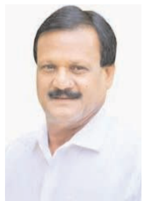
राज्यसभा उम्मीदवारी पर अपनी इच्छा जाहिर करते हुए कहा कि