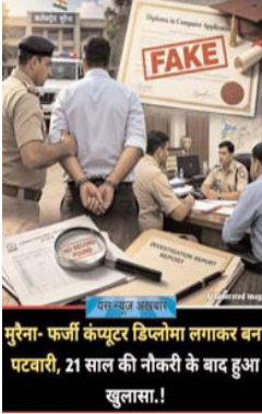
मुरैना- फर्जी कंप्यूटर डिप्लोमा लगाकर बना पटवारी, 21 साल की नौकरी के बाद हुआ खुलासा।

जांच रिपोर्ट के आधार पर कोतवाली थाना पुलिस ने आरोपित पटवारी के खिलाफ कूटरीचित दस्तावेज बनवाकर नौकरी हासिल करने के आरोप में अपराध पंजीबद्ध कर लिया है। पुलिस अब आगे की कार्रवाई करते हुए आरोपी की गिरफ्तारी की तैयारी में है।